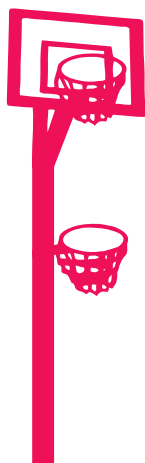
Panier latéral bas